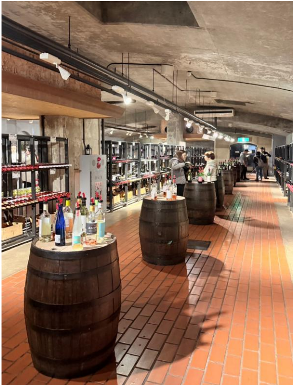
◀甲州市産ワイン専門店「ぶどうの丘」