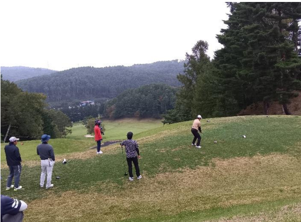
眺めの良いコースで「ナイスショット！」

10月7日(火)、会員同士の親睦交流を目的にゴルフ大会が開催されました。本年は「たまにはいつもと違う場所」との考えから塩尻市の「塩嶺カントリークラブ」まで足を延ばし、18名が集まる盛況となりました。