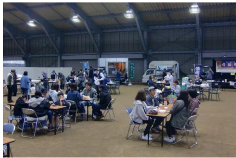
キッチンカーと屋台の料理に舌鼓

去る11月9日、サンアリーナ(中川村)にて、中川村商工会主催の恒例行事「なかがわ商工祭」が開催されました。 今年で50回を迎えた「中川文化祭」との、初となる共同開催。天候はあいにくの雨模様で、メイン企画であった熱気球体験は中止となりましたが、屋根付きグラウンドであるサンアリーナは終日村内外からの多くの来場者が集まる盛況の会となりました。