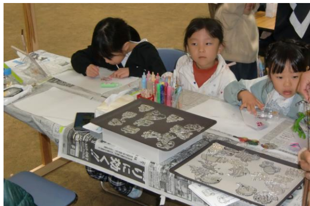
中川商工祭の垂れ幕(写真上)／出店者のひとつ「くりっこ工房」の手づくりオーナメントコーナーに集まる子どもたち