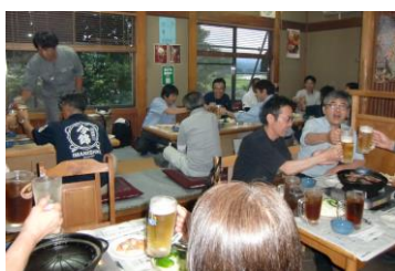
暑気払い会場にて

去る7月25日、全国労働安全週間の一環として「ハラスメント講習会」が開催され、会員約20名が参加しました。毎年、全国労働安全週間（7月第1週）の実施を受けて労働災害防止、労働環境の改善などを目的とした講習会を実施しています。今年も「ハラスメント」事例を交え、事業所で行う多様なハラスメントについて知る機会として、たほか、事業主としての防止策や対応策についても学びを深めました。